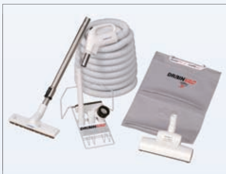
Osnovni kit z globinsko krtačo

DRAINVAC Powerful cleaning • Powerful results