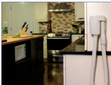
WallyFlex sesalna cev